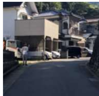
誘導係 立ち位置例 1