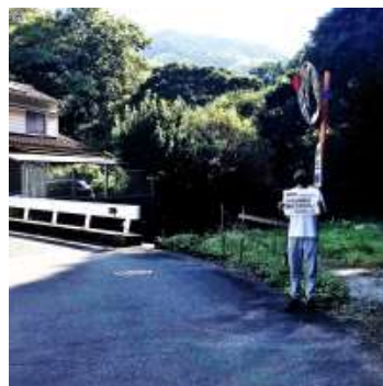
誘導係 立ち位置例 2